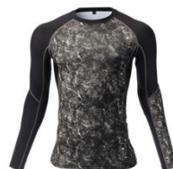
模様がある。単色ではない。