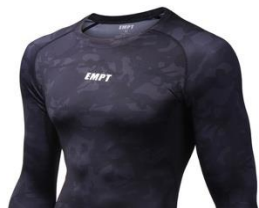
模様があるが 単色と認定できます。