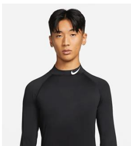
ロゴが入っている