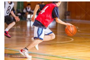
コンプレッションの ウェアではない