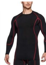
ラインに同系色では 無い色がついてる